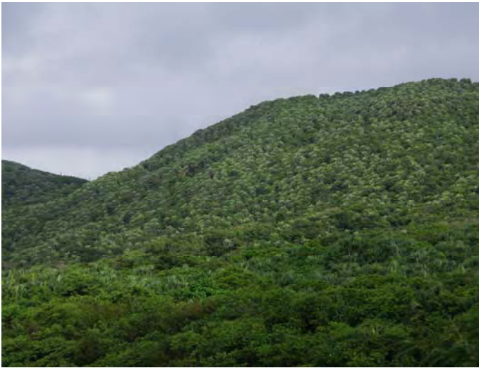
ビロウ林が発達した久部良岳天然保護区域（与那国町）