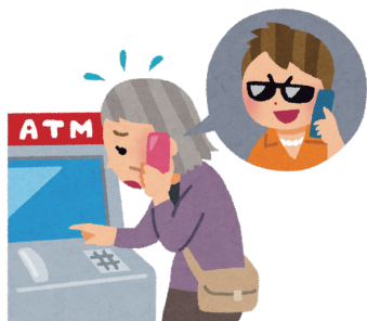
【沖縄県における特殊詐欺の被害状況】

被害に遭った人のほとんどが「まさか自分が被害に遭うとは思わなかった」といいます。それだけ手口が複雑巧妙化しており、被害に遭っていることすら気づかなかったり、「気がついたら被害に遭っていた」と言う人も多いのです。